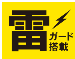
雷サージ軽減部品内蔵

家庭用コンセントタップ(2個口)+USB充電ポート付き。 コンセントを使いながら、スマートフォンや音楽プレーヤー などを充電することができます。