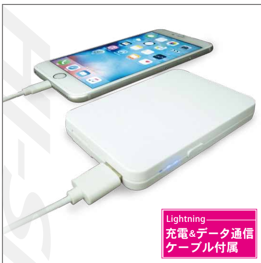
Lightning 充電&データ通信 ケーブル付属