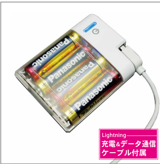
Lightning 充電&データ通信 ケーブル付属