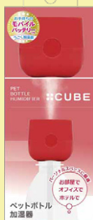
SH-CB35 RD レッド