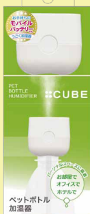
SH-CB35 WT ホワイト