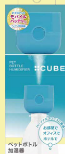
SH-CB35 BL ブルー

品名: ペットボトル加湿器キューブ ホワイト 品番: SH-CB35 WT J A N : 4936960-116603