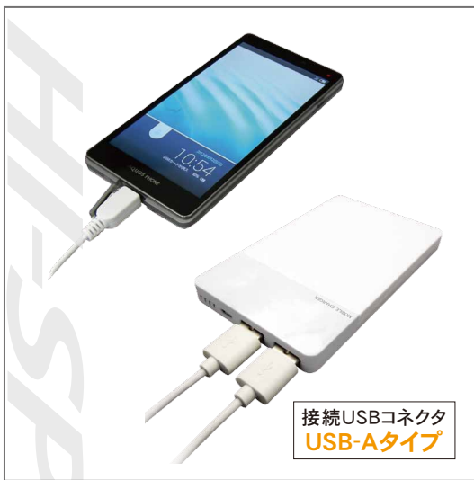
接続USBコネクタ USB-Aタイプ