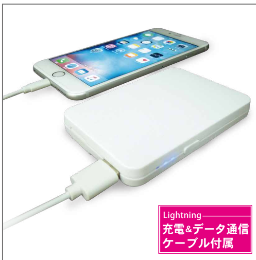
Lightning 充電&データ通信 ケーブル付属