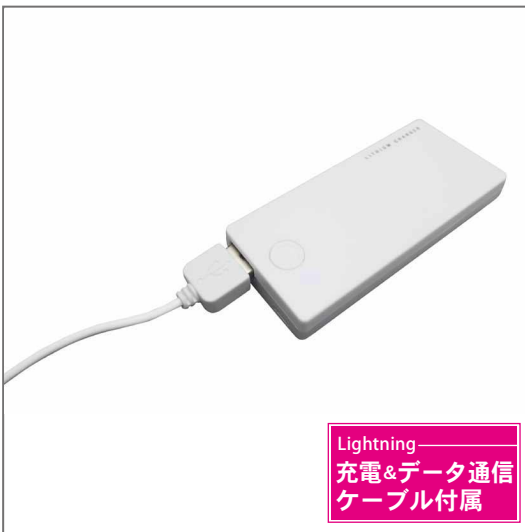
Lightning 充電&データ通信 ケーブル付属